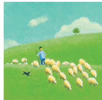
『とおいとおいおか』(至光社)より 2005年(個人蔵)