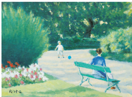
公園の母子 2019年(個人蔵)