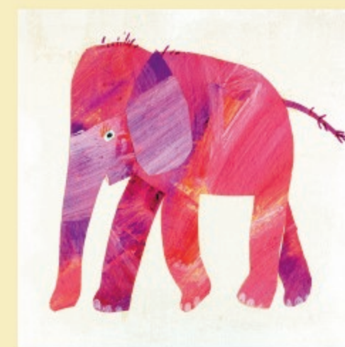
エリック・カール ピンクの象 1972年 Eric Carle, Pink elephant. Collection of The Chihiro Art Museum.