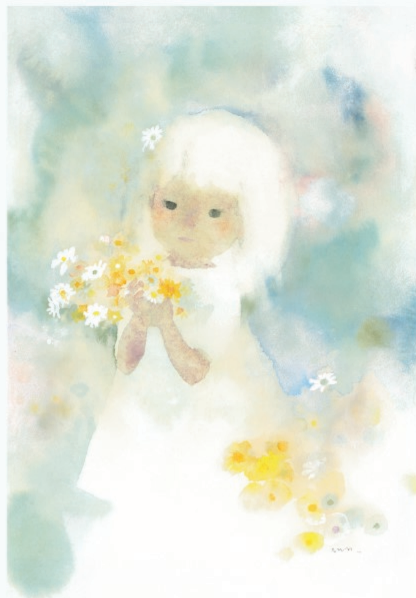
いわさきちひろ 花を持つワンピースの少女 1969年頃