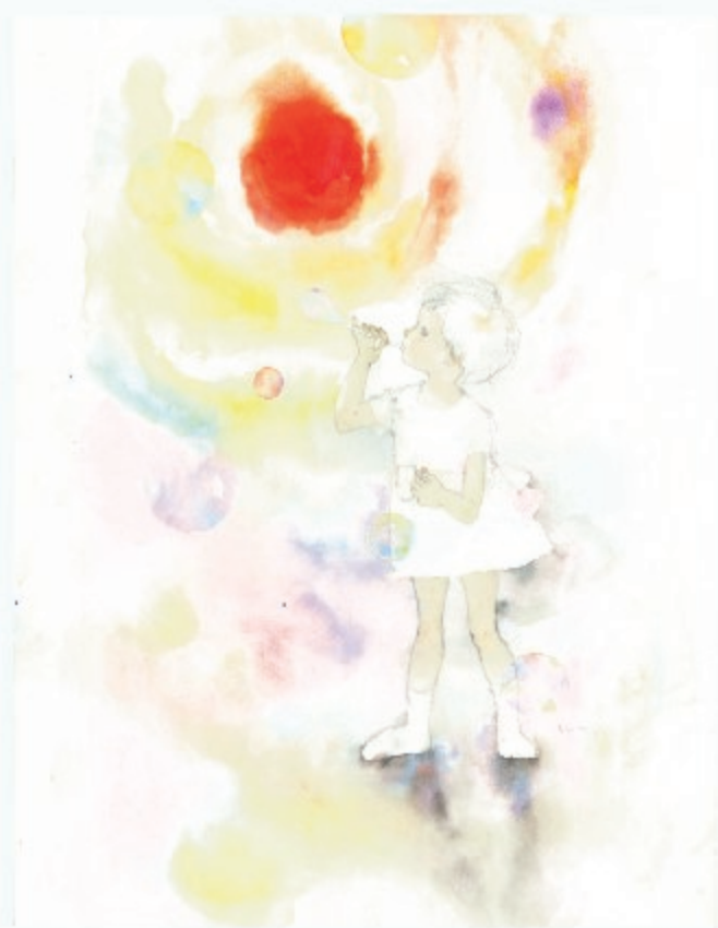
いわさきちひろ しゃぼん玉をふく少女 1969年