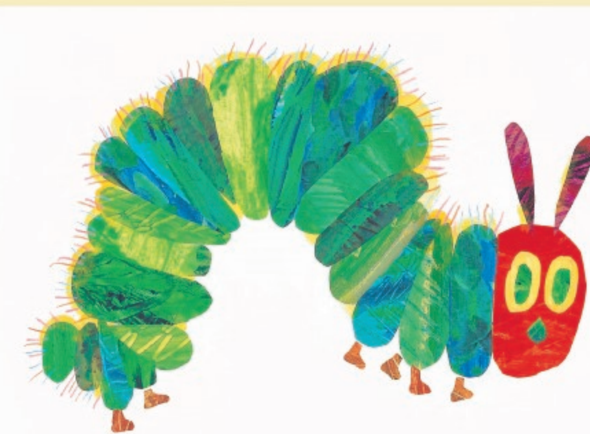
エリック・カール『はらぺこあおむし』のイメージ Eric Carle, image from The Very Hungry Caterpillar. Collection of The Chihiro Art Museum. ©1999 by Penguin Random House LLC.