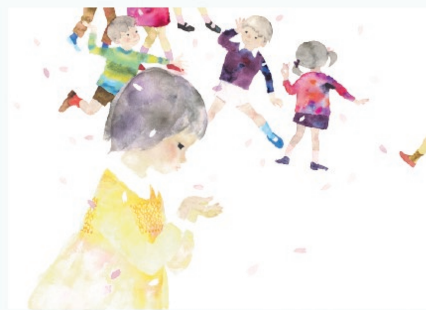
いわさきちひろ 桜の花びらを見つめる子ども 1968年

※イベントの詳細は、ちひろ美術館ホームページでご案内します。参加費のほか別途入館料が必要です。(高校生以下無料)