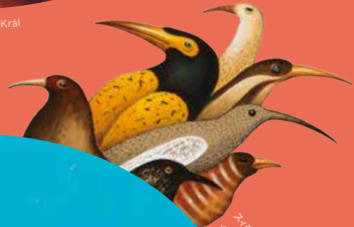
△シモナ・チェホヴァー《動物家のエリシュカ》(部分) 2018年(スロバキア) ©Simona Čechová △ヴラジミール・クラール《鳥の伝説》(部分) 2013年(スロバキア) ©Vladimír Král