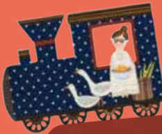
△テレザ・コレツカー・ヴォストラドフスカー 《電車の中のさんぽ》 2017年(チェコ) ©Tereza Korecká Vostradovská