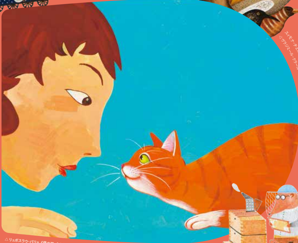
△リュボスラフ・パロ《僕の猫、タムタム》(部分) 2017年(スロバキア) ©Luboslav Palo