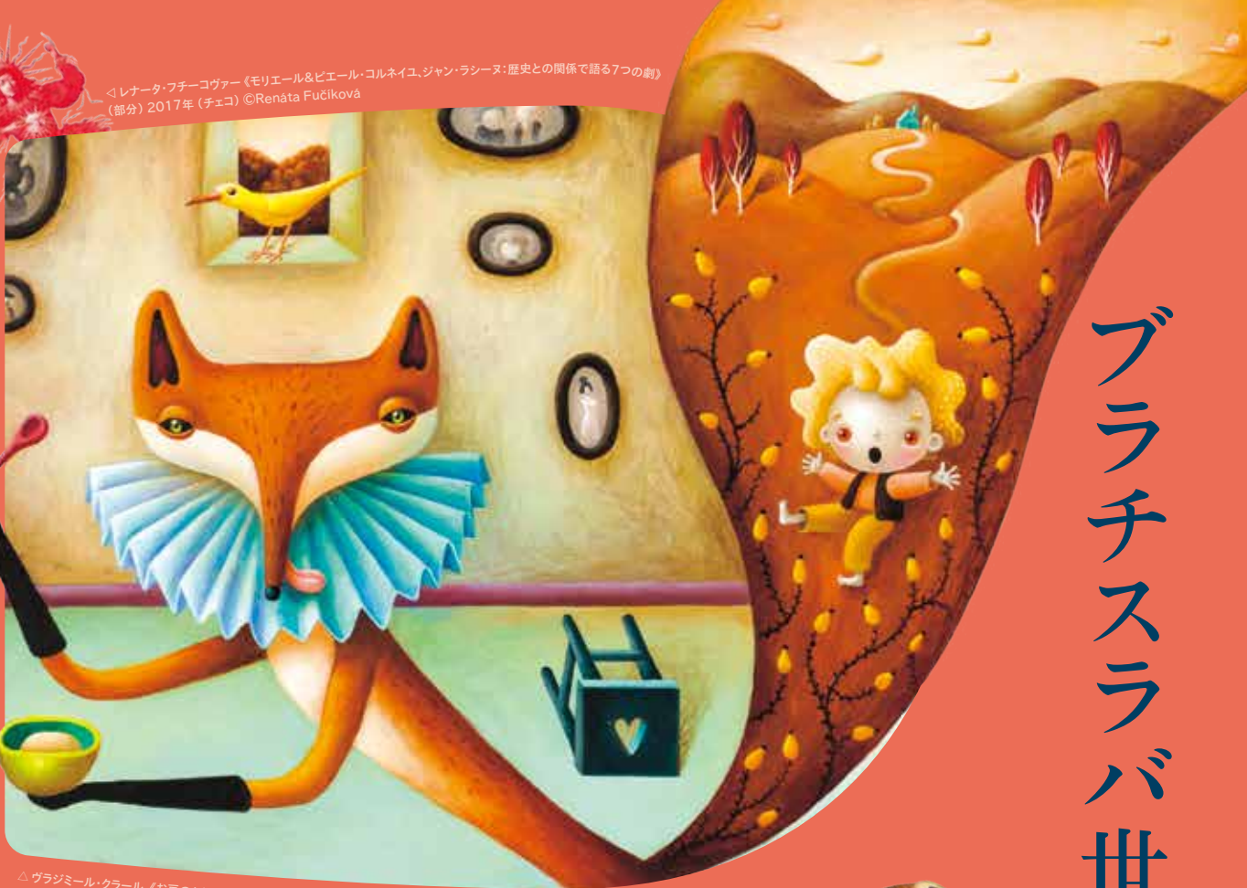
△レナータ・フチコヴァー《モリエール&ピエール・コルネイユ、ジャン・ラシーヌ：歴史との関係で語る7つの劇》 (部分) 2017年(チェコ) ©Renáta Fučíková