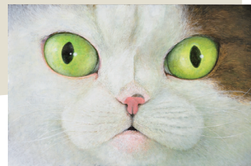
町田尚子『ネコツメのよる』原画