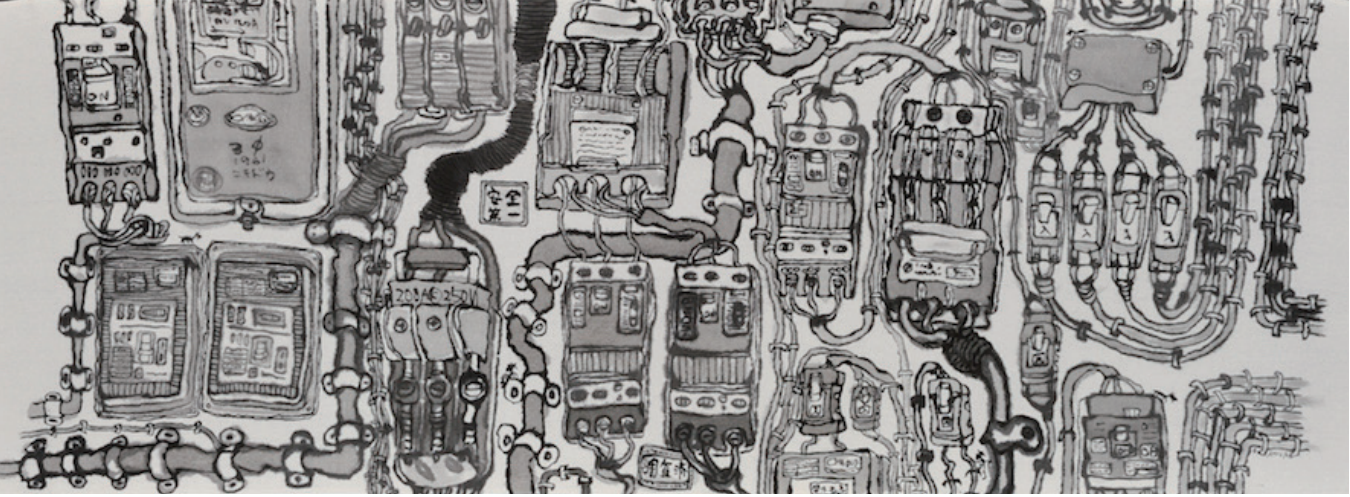
こしだミカ『でんきのビリビリ』原画