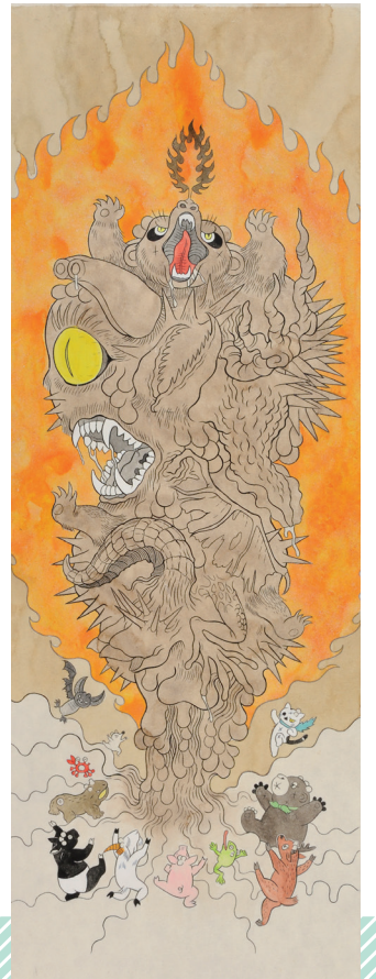
石黒亜矢子『えとえとがっせん』原画

2018年11月18日[日] 13:00 - 16:30 (12:30 開場) 奈良県立美術館レクチャールーム 主催：絵本学会、奈良県立美術館