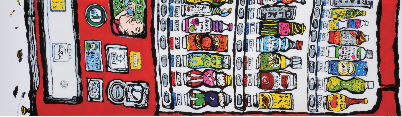
こしだミカ『でんきのビリビリ』原画