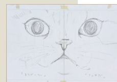
町田尚子『ネコツメのよる』ラフ